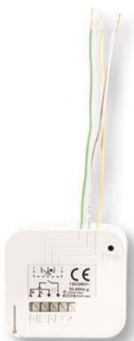
GO-ER MINI LIGHT